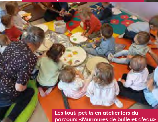
Les tout-petits en atelier lors du parcours «Murmures de bulle et d'eau»